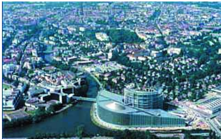
Parlamentul European (Strasbourg). Vedere generală

(Verts/ALE) cu 42 membri; - Grupul confederal al stângii unite Europene/Stânga Verde Nordica (GUE/NGL) cu 41 membri; - Grupul pentru Democrație și Independență (IND/DEM) cu 36 membri; - Grupul Uniunii pentru Europa Națiunilor (UEN) cu 27 membri; - Grupul celor neînscrisi (NI) cu 30 membri. Parlamentul European mai numeste și un