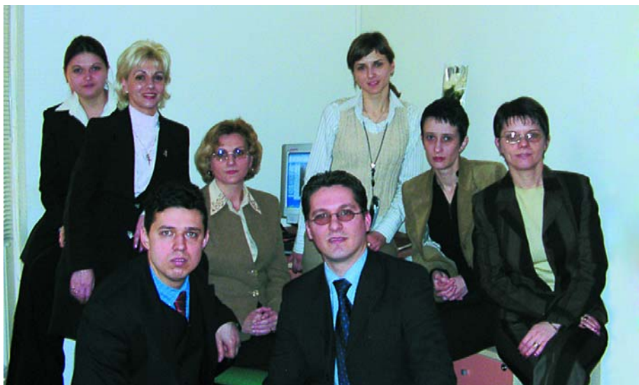
Grupul Consilierilor de Integrare de la Autoritatea Națională Sanitar-Veterinară și pentru Siguranța Alimentară